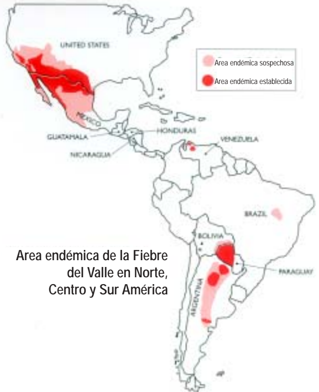
Area endémica de la Fiebre del Valle en Norte, Centro y Sur América

De todas las personas infectadas con la Fiebre del Valle, una de cada 200 personas desarrolla la forma diseminada de la Fiebre del Valle, la cual es devastadora y puede ser mortal. Estos son los casos en los que la enfermedad se extiende fuera de los pulmones a través del sistema sanguíneo, típicamente a la piel, los huesos, y las membranas que rodean el cerebro causando la meningitis.